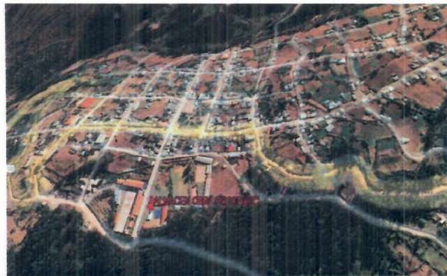
Imagen 1: Ubicación de almacén de obra.