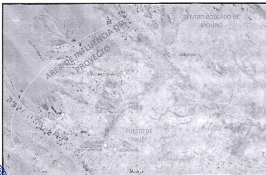
FIGURA N° 02 AREA DE INFLUENCIA DEL PROYECTO