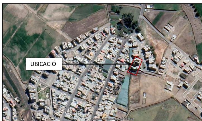
Imagen: Imagen satelital de ubicación de área deportiva, Mz T Lote 8