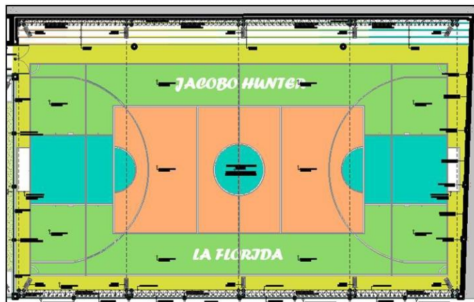
Plano 2, ara de Losa deportiva multiusos