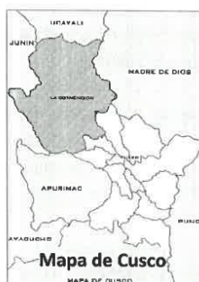
Mapa de Cusco