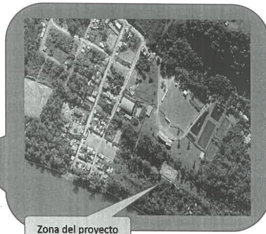
Zona del proyecto