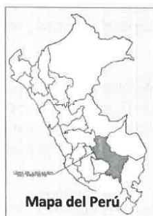
Mapa del Perú