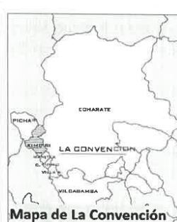
Mapa de La Convención