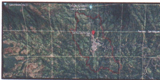
Fig. N°1: Mapa de Localización del distrito de Santo Domingo