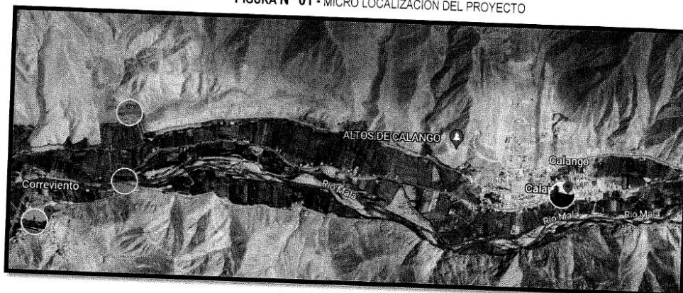
FIGURA N° 01 - MICRO LOCALIZACIÓN DEL PROYECTO

El consultor de obra debe contar con inscripción vigente en el RNP en la especialidad DE CONSULTORIAS EN OBRAS DE SANEAMIENTO Y AFINES, en la CATEGORIA B O SUPERIOR.