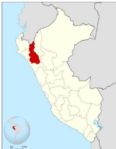
Imagen N° 01: Ubicación Política