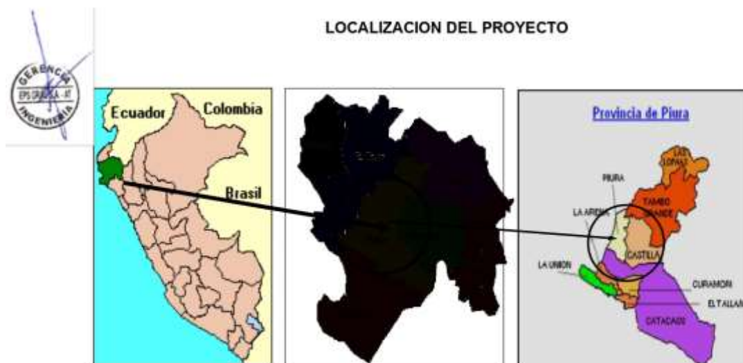
Esquema de Ubicación Geográfica en el Distrito de Piura