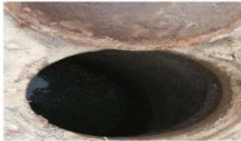
BUZONES EN MAL ESTADO COLAPSADO POR ATORON EN LA RED COLECTORA