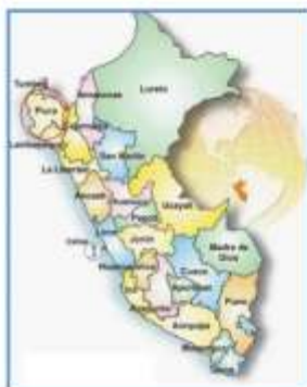
Gráfico N° 01: Mapa del

Localización departamental, provincial y distrital de la zona de estudio.