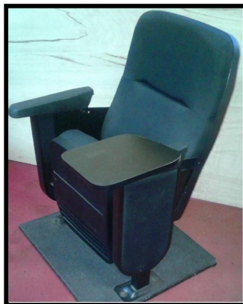
BUTACAS (Modelo y color referencial)

Calle San Marcos N° 351 – Pueblo Libre – Central Telefónica: 7480888, anexo 8385