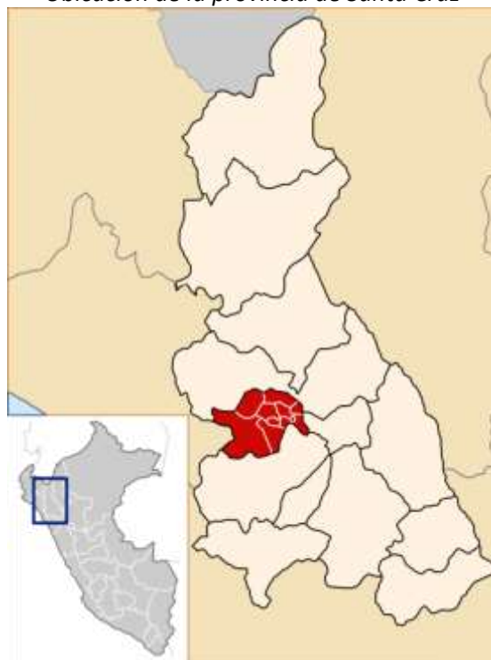
Figura 3 Ubicación del distrito de Pulan en la provincia de Santa Cruz