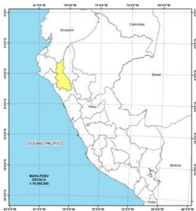
Figura 2 Ubicación de la provincia de Santa Cruz