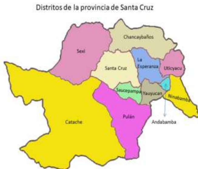
Figura 4 Ubicación del Puente Pampa El SURO