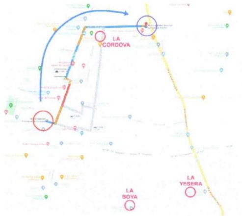
GRAFICO N° 03. MAPA DE VIAS DE ACCESO A LA ZONA.

Vías de comunicación de Camaná – Samuel Pastor (La Pampa) y las 03 estaciones de bombeo.