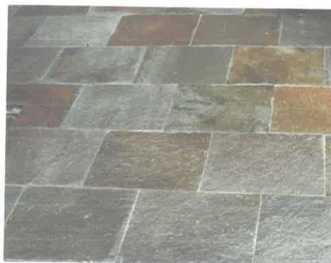
PIEDRA LAJA AMARRE AMERICANO para alto tránsito peatonal (3 a 5 cm)