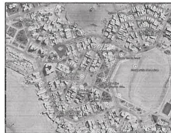
Figura N°1: Ubicación de la I.E. N° 105.

El perfil del proyecto indica que se construirán las siguientes áreas: