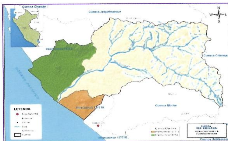
Gráfico N° 03: Ubicación de Cuenca Chicama

El proyecto se encuentra ubicado en la cuenca Chicama, micro cuenca del río Santa Ana; pertenece al cuadrante 15f en las cartas nacionales, dicha cuenca cuenta con una superficie de 6097.36 Km 2 .