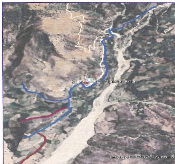
Gráfico N° 02: Ubicación Canal de Santa Ana