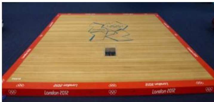
Imagen 01 – Imagen referencial de plataforma de competición 4m x 4m