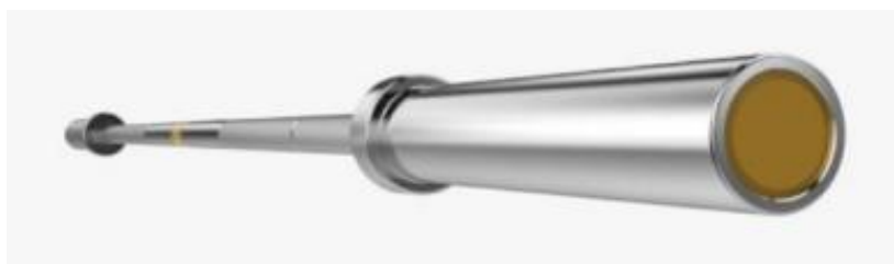
Imagen 04 – Imagen referencial de barra de competición mujer 15 kg