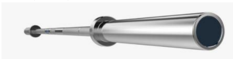
Imagen 03 – Imagen referencial de barra de competición hombre 20 kg