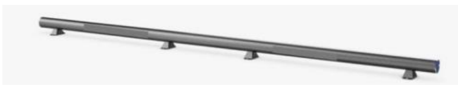
Imagen 02 – Imagen referencial de barrera de seguridad para pesas