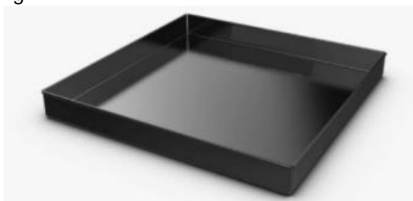
Imagen 10 – Imagen referencial de soporte de resina