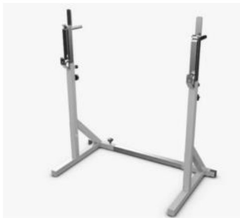
Imagen 12 – Imagen referencial de Rack de sentadillas