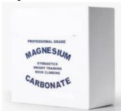
Imagen 13 – Imagen referencial de caja de magnesio