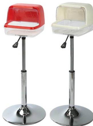
Imagen 09 – Imagen referencial de soporte de magnesio

“Decenio de la Igualdad de Oportunidades para mujeres y hombres” “Año del Bicentenario, de la consolidación de nuestra independencia, y de la conmemoración de las heroicas batallas de Junín y Ayacucho”