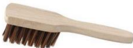
Imagen 15 – Imagen referencial de cepillo de barra