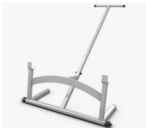
Imagen 06 – Imagen referencial de palanca levantadora de pesas