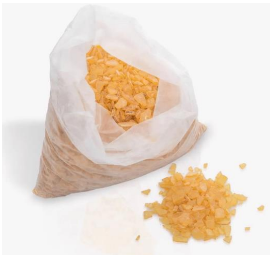
Imagen 14 – Imagen referencial de resina