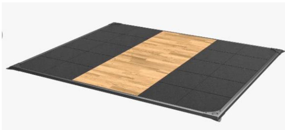
Imagen 11 – Imagen referencial de plataforma de calentamiento 2.5 m x 3 m

“Año del Bicentenario, de la consolidación de nuestra independencia, y de la conmemoración de las heroicas batallas de Junín y Ayacucho”