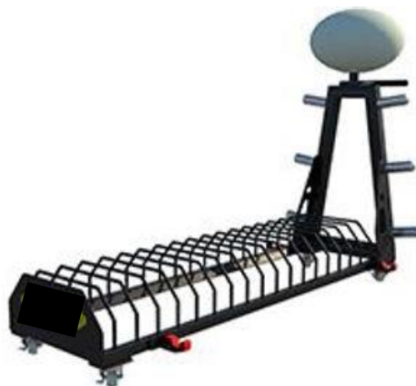
Imagen 07 – Imagen referencial de soporte para discos de levantamiento de pesas con soporte de magnesio incluido

“Año del Bicentenario, de la consolidación de nuestra independencia, y de la conmemoración de las heroicas batallas de Junín y Ayacucho”