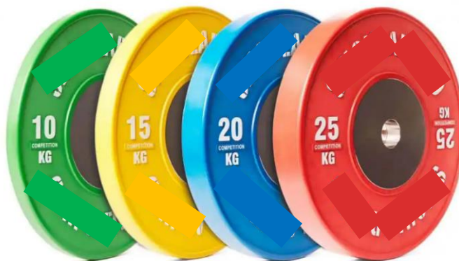
Imagen 16 – Imagen referencial de discos de competencia de Levantamiento de pesas