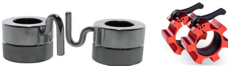
Imagen 05 – Imágenes referenciales de collares sujetadores de pesas

“Año del Bicentenario, de la consolidación de nuestra independencia, y de la conmemoración de las heroicas batallas de Junín y Ayacucho”