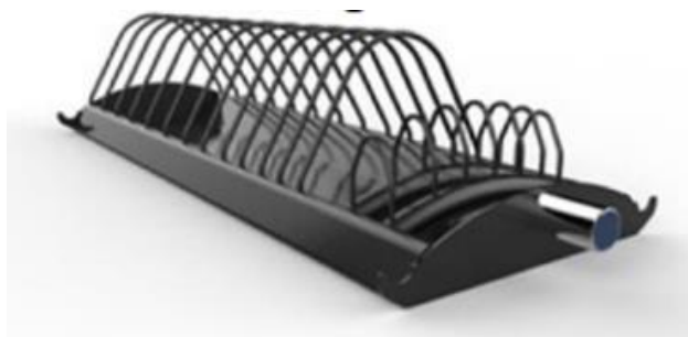
Imagen 08 – Imagen referencial de soporte para discos de levantamiento de pesas