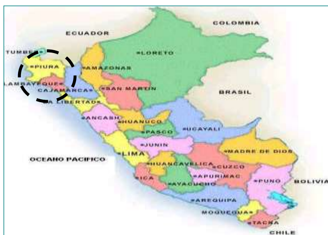
IMAGEN N° 01. PERÚ, Localización Geográfica del departamento de Piura

DEPARTAMENTO : PIURA PROVINCIA : HUANCABAMBA DISTRITO : HUARMACA CASERÍO : SANTA CRUZ DE CRIA