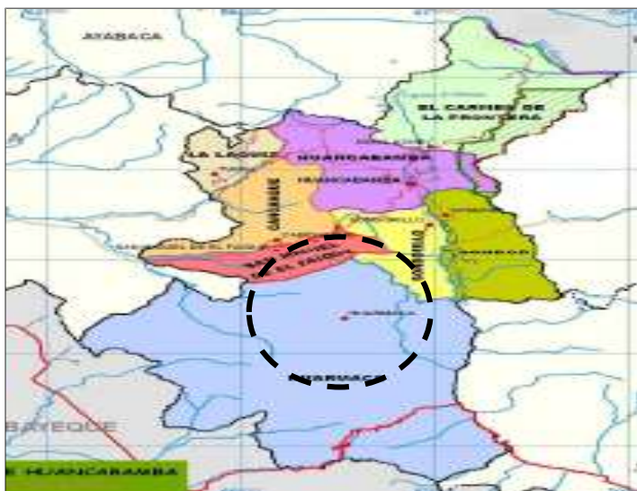
IMAGEN N° 03. Localización Geográfica del distrito de Huarmaca.