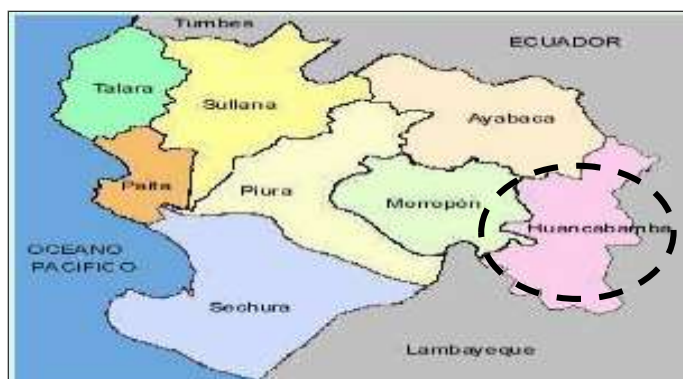
IMAGEN N° 02. Localización Geográfica de la provincia de Huancabamba