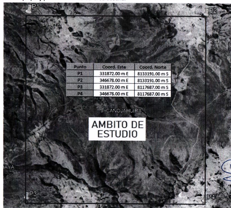
Figura 1: Delimitación del ámbito de estudio