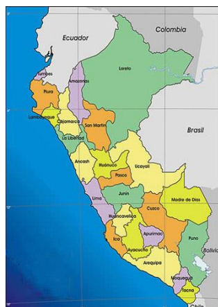
Mapa de macro localización del Perú