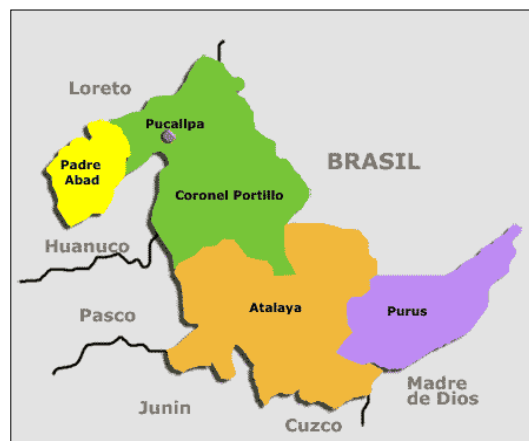
Mapa macro localización del departamento de Ucayali