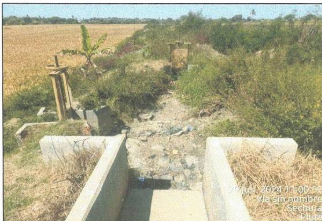
BELLAVISTA – PIURA- PERÚ

MUNICIPALIDAD DISTRITAL DE BELLAVISTA DE LA UNIÓN