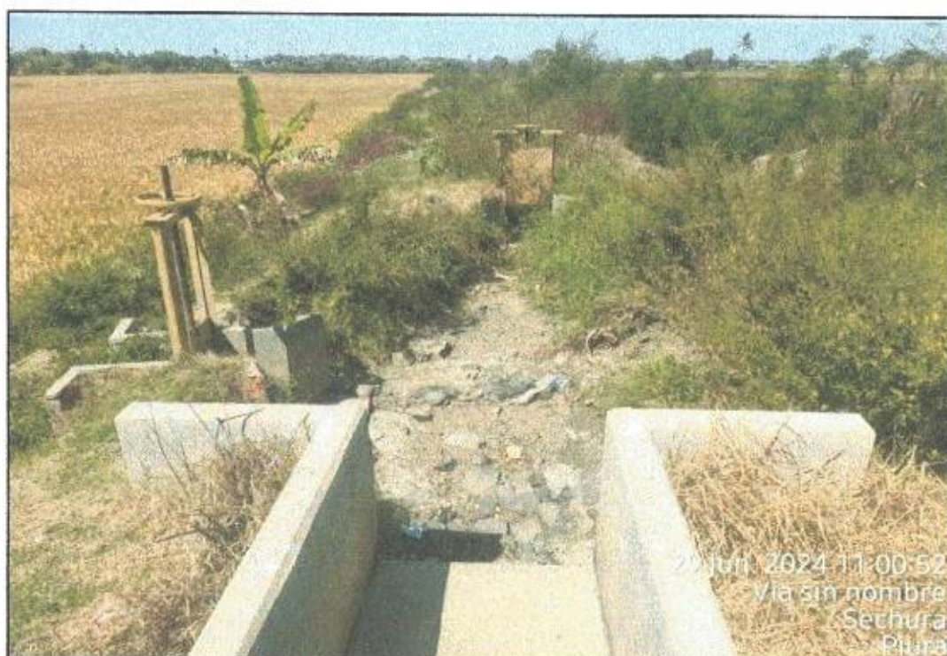
BELLAVISTA – PIURA- PERÚ

MUNICIPALIDAD DISTRITAL DE BELLAVISTA DE LA UNIÓN