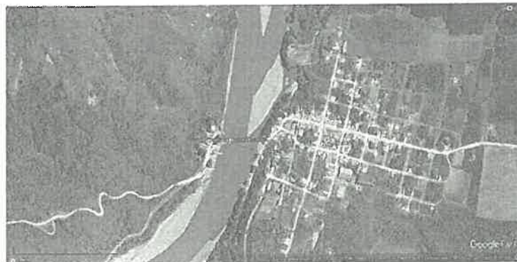
Imagen Satelital HUALLAPE

Esquema de localización del área seleccionado para el Puente Vehicular en la localidad de Hualape