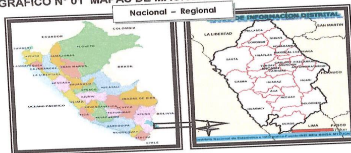
GRAFICO N° 01 MAPAS DE MACROLOCALIZACIÓN DEL ESTUDIO