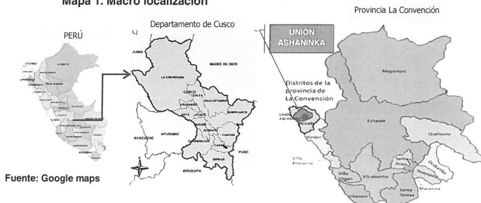
Mapa 1. Macro localización

Los mapas siguientes vemos la macro y micro localización de ubicación del proyecto.