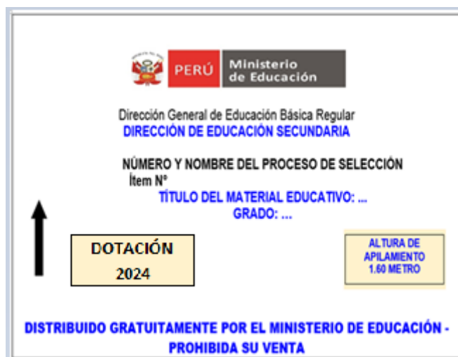
Figura N.º 03