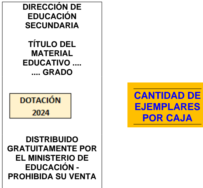
Figura N.º 04