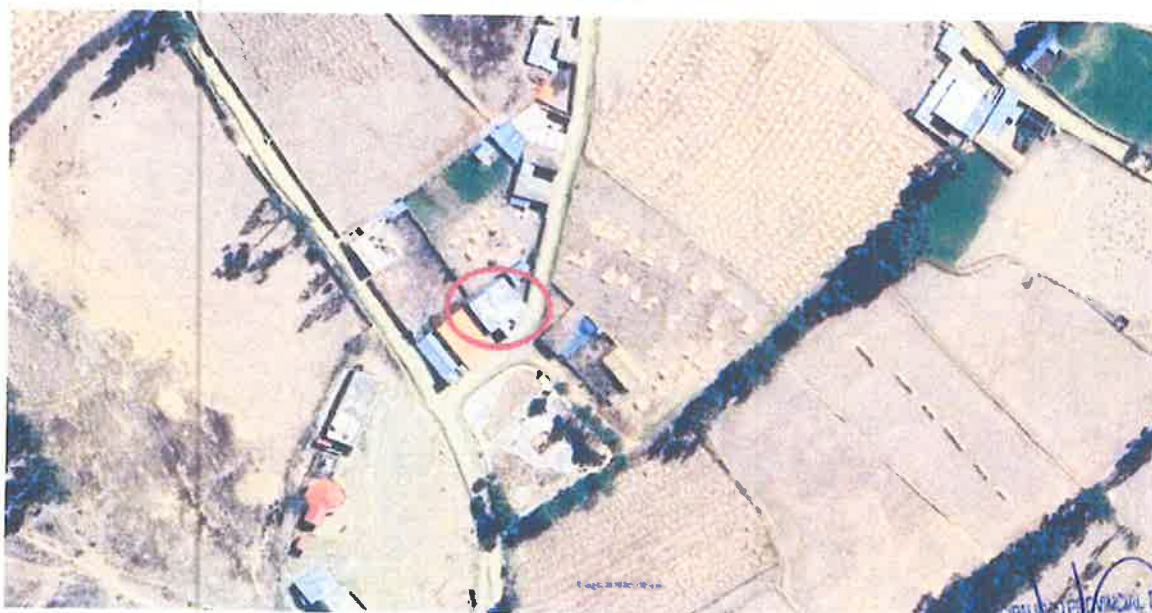
Figura 3: Ubicación Geográfica del Centro Poblado.

MUNICIPALIDAD PROVINCIAL DE TAYACAJA Arg. Edgar J. Asto Peña SUB GERENCIA DE ESTUDIOS Y PROYECTOS DE INVERSIÓN