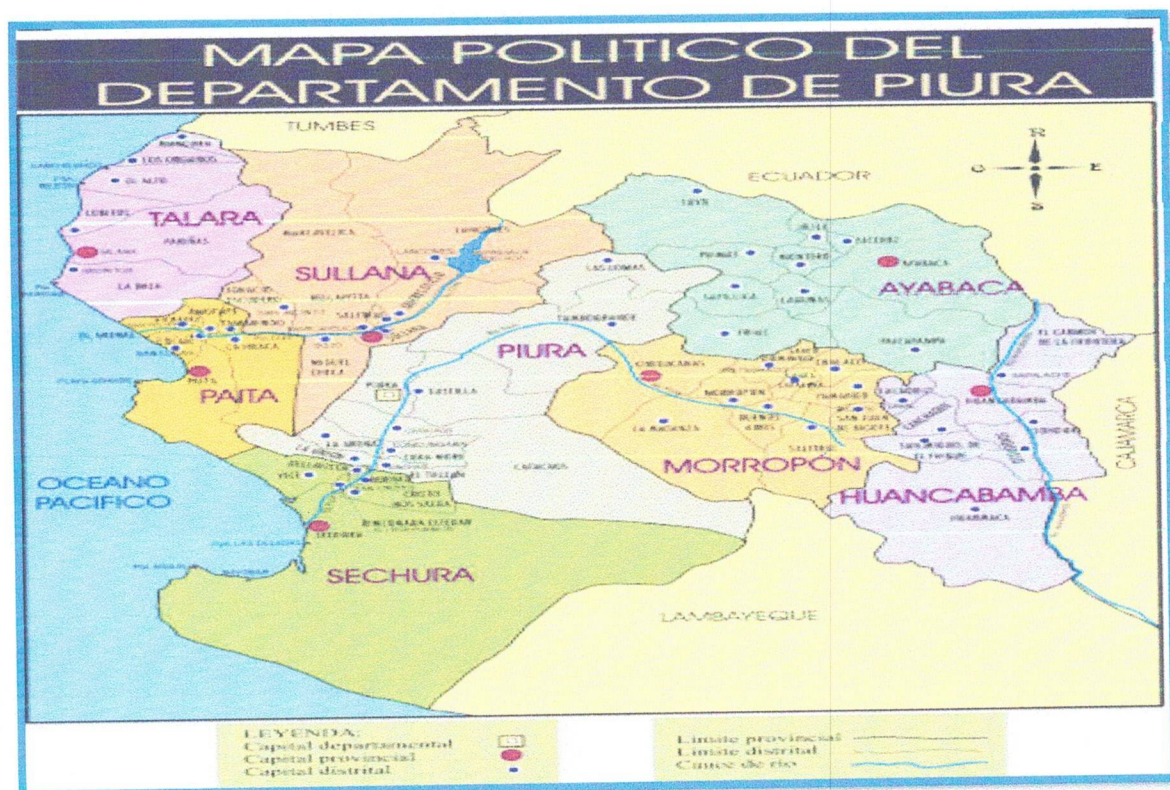
Grafica N.º 01. Ubicación Geográfica del Proyecto