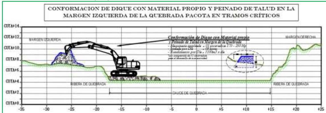
Imagen referencial de la actividad a realizar por la maquinaria.