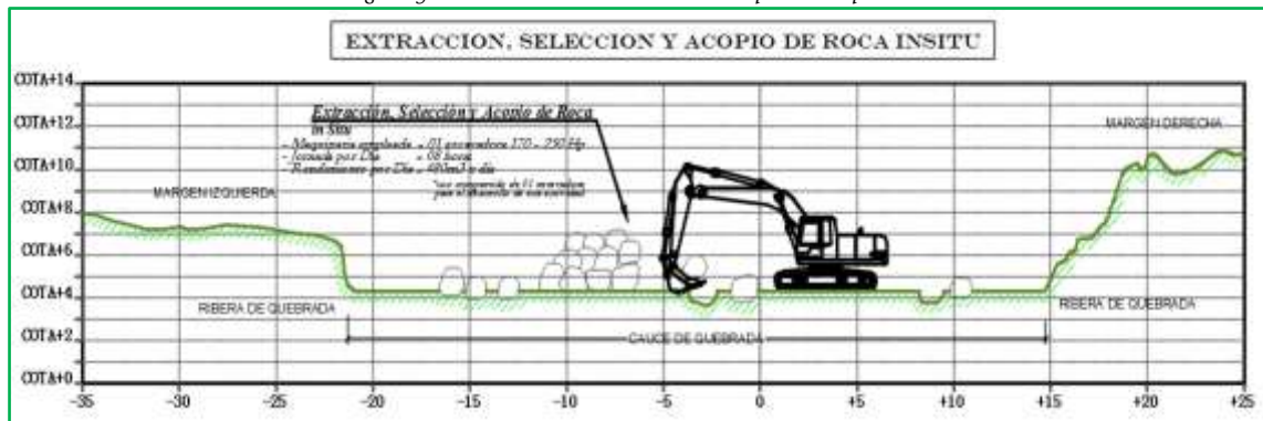
Imagen referencial de la actividad a realizar por la maquinaria.