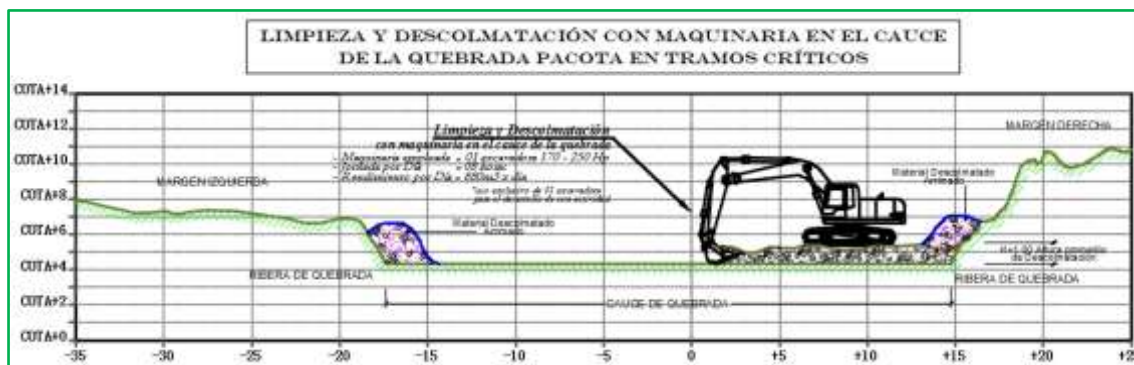
Imagen referencial de la actividad a realizar por la maquinaria.