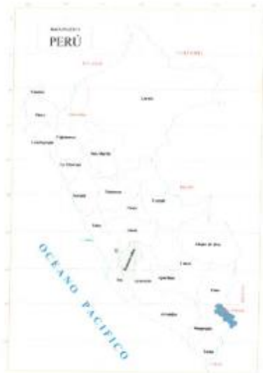
Mapa: Departamental del Perú.