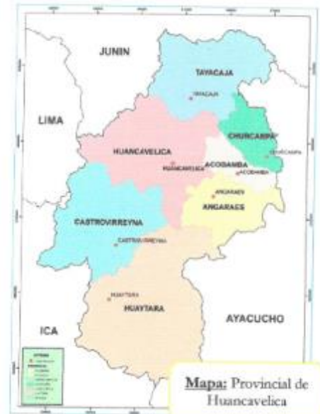
Mapa: Provincial de Huancavelica