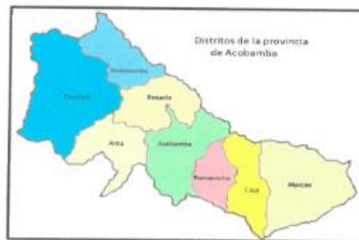
Mapa: Distrital de Acobamba