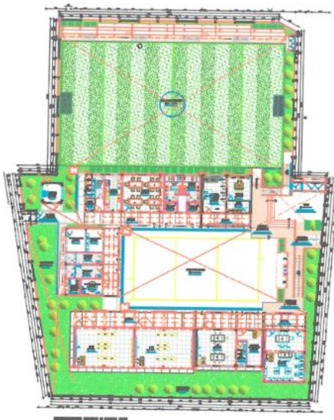
Plano de planteamiento general