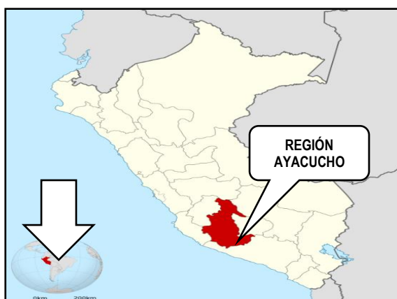
Mapa 01: Macro Localización del Proyecto

Ubicado al margen derecho del río tinkuy, a una distancia de 6 kilómetros desde la capital del distrito de Llochegua.