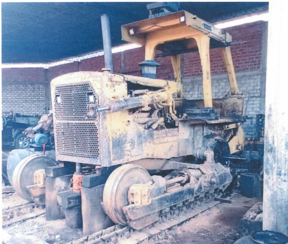
Piñón De Mando Roto