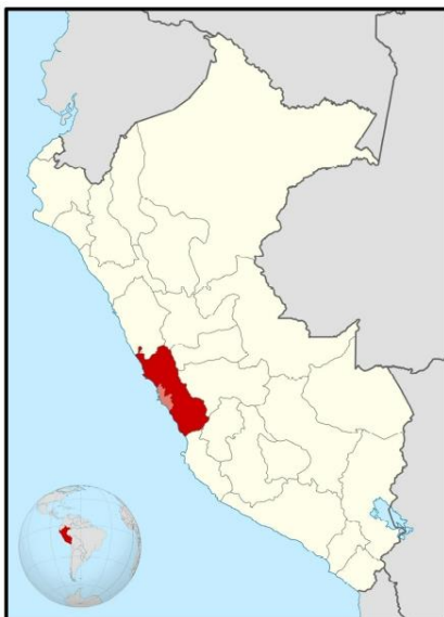
UBICACIÓN GEOGRÁFICA DEL DEPARTAMENTO DE LIMA

Región : Lima Departamento : Lima Provincia : Lima Distrito : Miraflores