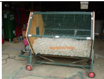
* imagen referencial