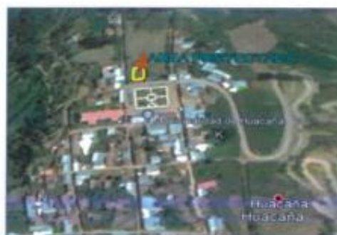
Imagen satelital de la comunidad de Huacaña