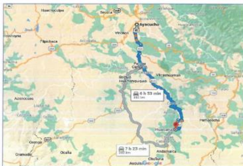
Imagen satelital de la vía de acceso desde la ciudad de Ayacucho hasta la comunidad de Huacaña.

El acceso partiendo desde la ciudad de Huamanga – Cangallo - Huancapi – Querobamba – Morcolla – Huacaña. la carretera es una vía asfaltada, la distancia desde la ciudad de Ayacucho hasta la comunidad de Huacaña es de 252 km y el tiempo de recorrido es de siete horas con camioneta.