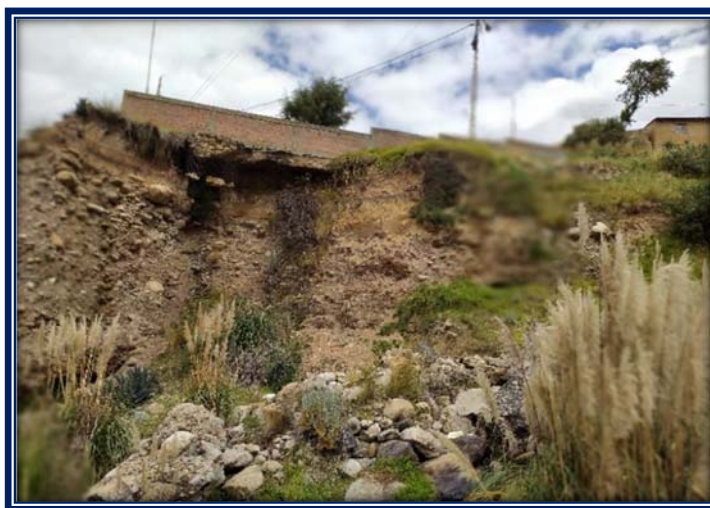
Vista de la Zona Afectada

En la Fotografía se observa el colapso del Talud natural, el cual requiere de protección inmediata