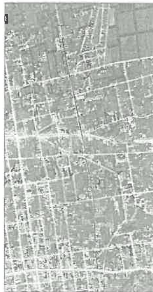
Figura 02. Vía a intervenir Jr. Alfonso Ugarte del distrito de Huancan