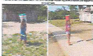
FOTO: VISTA GENERAL DEL LUGAR DONDE SE CONSTRUYERÁ LA CANCHA DE FÚTBOL