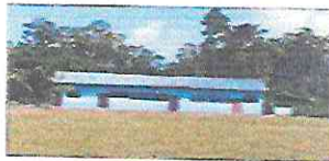
POSTOR N°02: VISTA DE LA INSTITUCIÓN EDUCATIVA PRATALLA N° 002