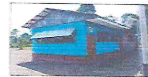
FOTO: INTERIOR DE LA MUNICIPALIDAD DISTRITAL DE SARAYACU