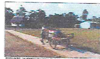
FOTO: VISTA GENERAL DEL LUGAR DONDE SE CONSTRUYERÁ LA CANCHA DE FÚTBOL