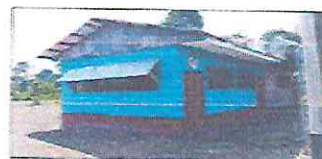
POSTOR N°02: VISTA DE LA INSTITUCIÓN EDUCATIVA PRATALLA N° 002