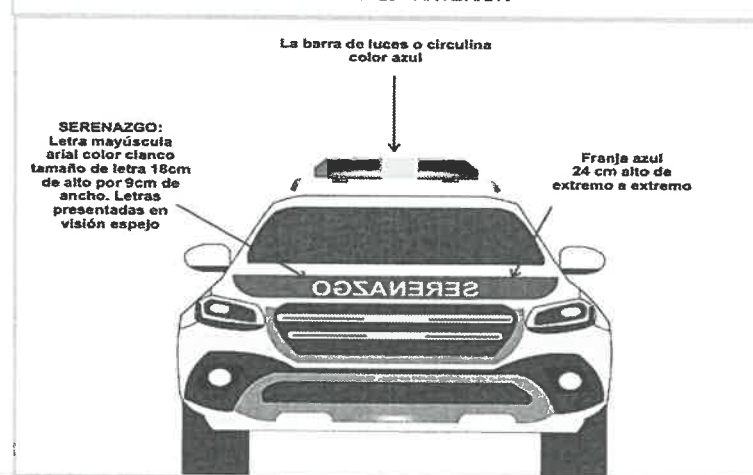
GRÁFICO N° 20 - ANTERIOR

SE ADJUNTA GRAFICO N°20,21,22. PARA DAR Estricto CUMPLIMIENTO A LO SEÑALADO.