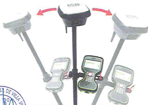
ROVER EQUIPO COMPLETO

CREADO MEDIANTE LEY N° 30279 DEL 03 DE DICIEMBRE 2014