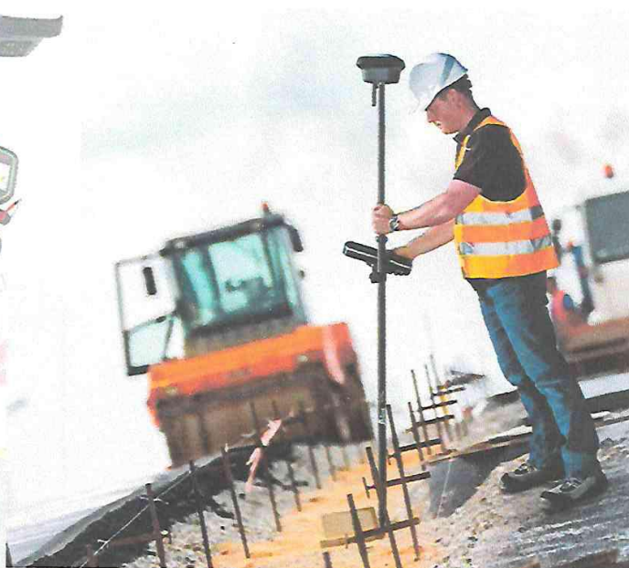
EQUIPO COMPLETO EN TRABAJO DE CAMPO