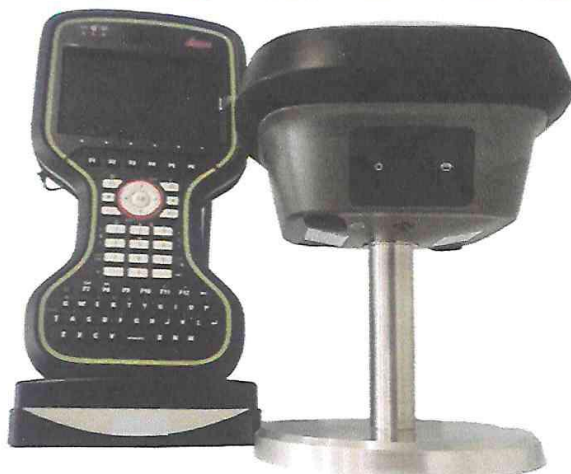
CONTROLADOR CS20 y RECEPTOR GS18 GNSS