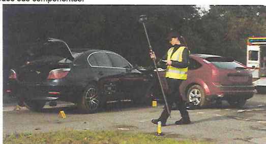
IMAGEN REFERENCIAL DE LOS EQUIPOS

DESCRIPCION: El bien deberá cumplir con las siguientes especificaciones técnicas, las cuales pueden ser superadas en todos sus componentes: