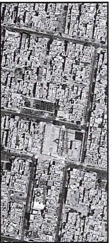
Micro Localización (Distrito Nuevo Chimbote – URB. LOS CIPRESES)