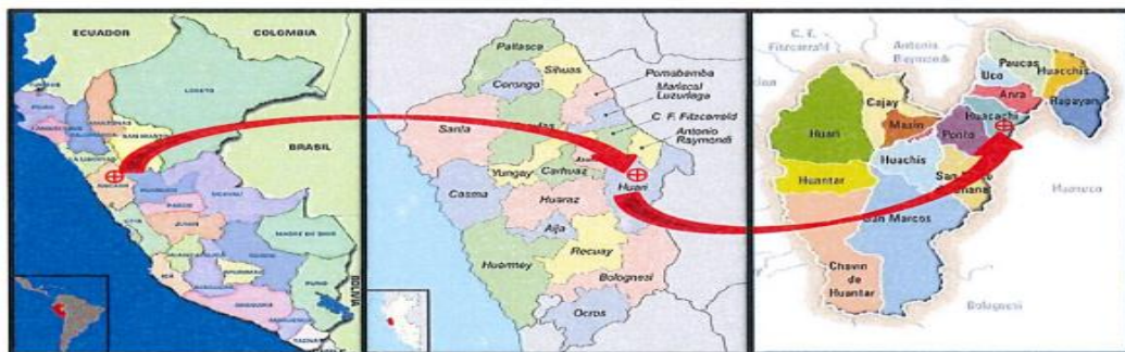
Distrito de Huacachi, provincia de Huari, departamento de Ancash.

Este : 0287990.24 m Norte : 8970731.25 m Altitud : 3595 m.s.n.m.