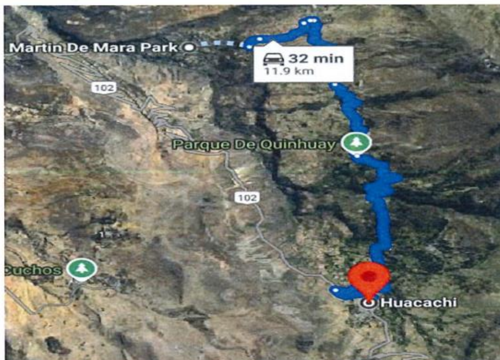
Lugar del proyecto.