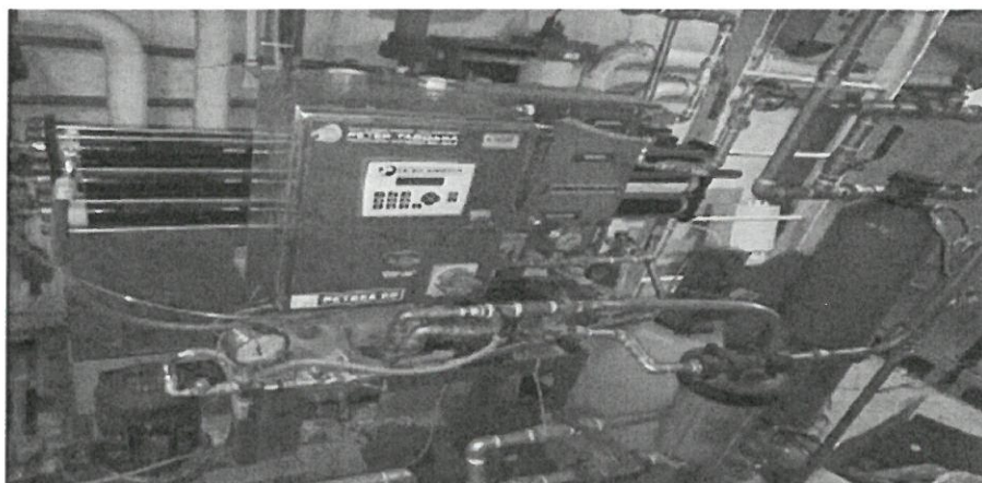
Imagen de la planta de ósmosis inversa.

El personal que realizará el mantenimiento, deberá contar con seguro complementario de trabajo de riesgo (SCTR), además deberá adoptar las normas de seguridad ocupacional con la adecuada indumentaria de trabajo EPP - EQUIPO DE PROTECCIÓN PERSONAL (arnés, casco, guantes, lentes de protección, entre otros).