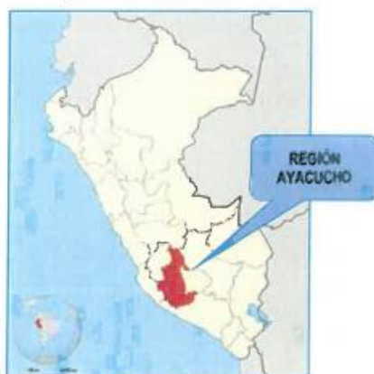
IMAGEN N°01: MACRO LOCALIZACIÓN DEL PROYECTO - NIVEL NACIONAL, REGIONAL, PROVINCIAL, DISTRITAL