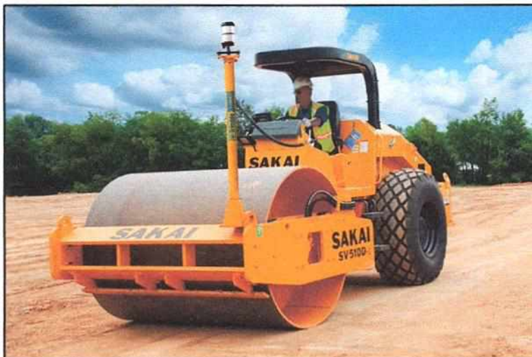
Figura N° 02 COMPACTACIÓN DE TERRENO