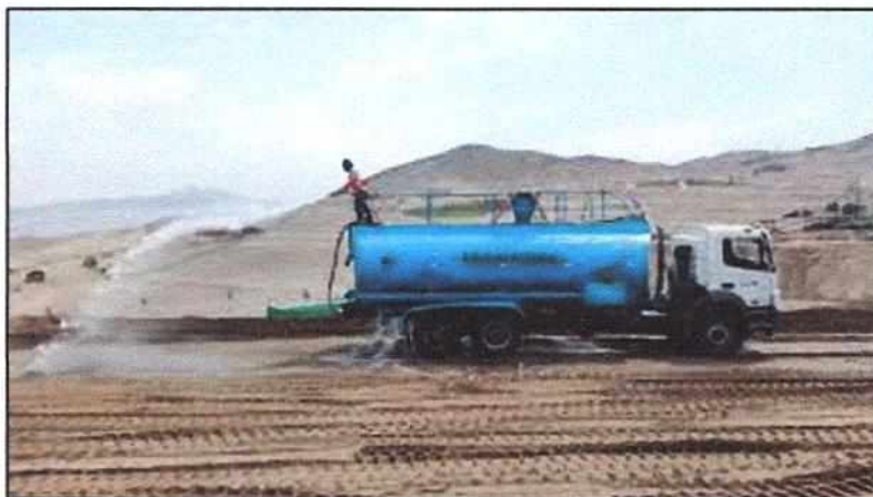
Figura N° 03 REGADO DE TERRENO