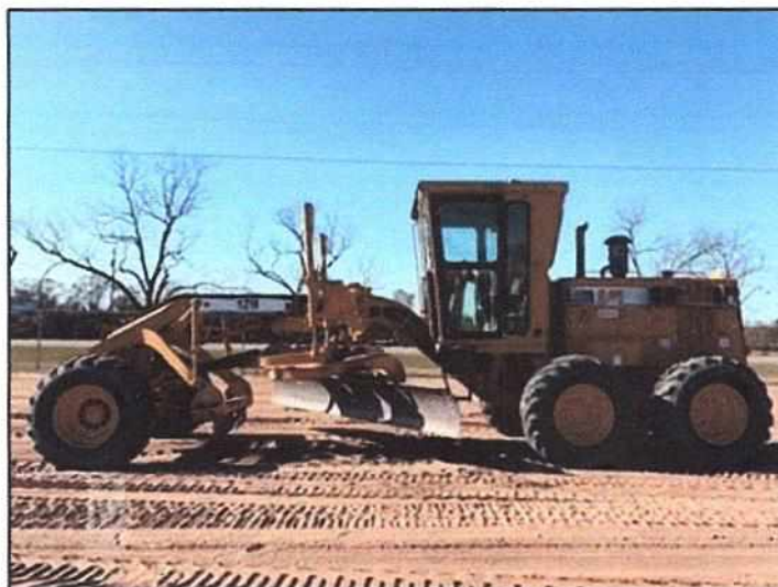
Figura 1: PERFILADO DE TERRENO

Finalmente, y una vez culminada estas actividades se procederá con el regado por medio de cisternas de agua hasta obtener una superficie húmeda y pareja.