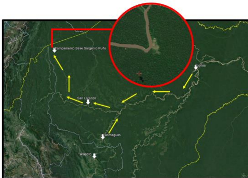
Figura 1. Ubicación del Campamento Base Sargento Puño (CBSP).

Al CBSP se puede llegar por cualesquiera de las siguientes rutas desde Iquitos o Tarapoto: