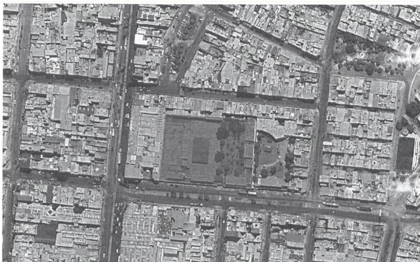
Imagen 01 – Imagen Satelital de la I.E donde se realizará el Proyecto.