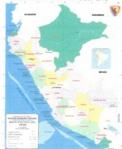
IMAGEN N° 02: UBICACIÓN DEL PROYECTO