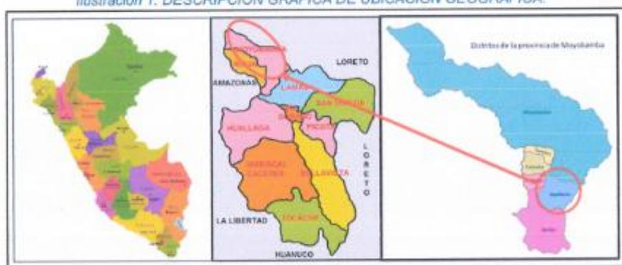
Ilustración 1: DESCRIPCION GRAFICA DE UBICACIÓN GEOGRAFICA.

DISTRITO : JEPELACIO PROVINCIA : MOYOBAMBA DEPARTAMENTO : SAN MARTIN LOCALIDAD : JEPELACIO