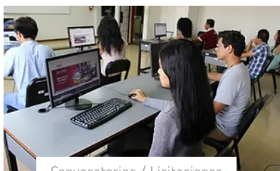
Convocatorias / Licitaciones