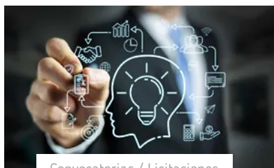
Convocatorias / Licitaciones