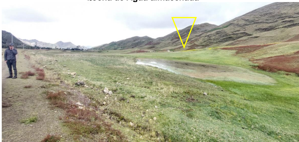
FOTO No 02 Qocha de Agua almacenada