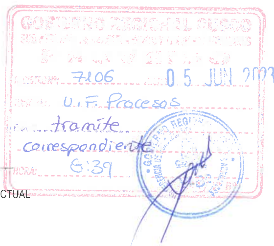
ABOG. VILMA PIMENTEL CABAÑAS RESPONSABLE (E) AREA DE GESTION CONTRACTUAL

Se adjunta 168 folios C.C Archivo UFGC/vpc