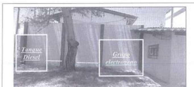
Vista de la futura ubicación del tanque de combustible (lado izquierdo) y Grupo electrógeno (lado derecho) del Árbol